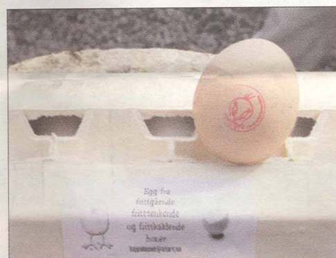
Et ordentlig hønseri må ha ordentlig kartonger og ordentlig stempel.